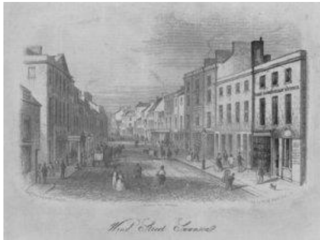
Wind Street, Abertawe, hen leoliad swyddfeydd The Cambrian .

Caiff erthyglau eu mynegeo yn ôl pwnc a'u trefnu yn ôl prif grwpiau Trafnidiaeth, Llongau, Trychinebau a Damweiniau, Cynllunio a Rheoli Tir, Adeiladau, Amaethyddiaeth, Diwydiant, Addysg, Iechyd a Lles, Crefydd, Gwleidyddiaeth, Troseddu, Diwylliant a'r Celfyddydau, Chwaraeon a Hamdden a Lluoedd mewn Lifrai. Gallwch ddefnyddio'r opsiwn chwilio i chwilio dan y penawdau pwnc hyn.