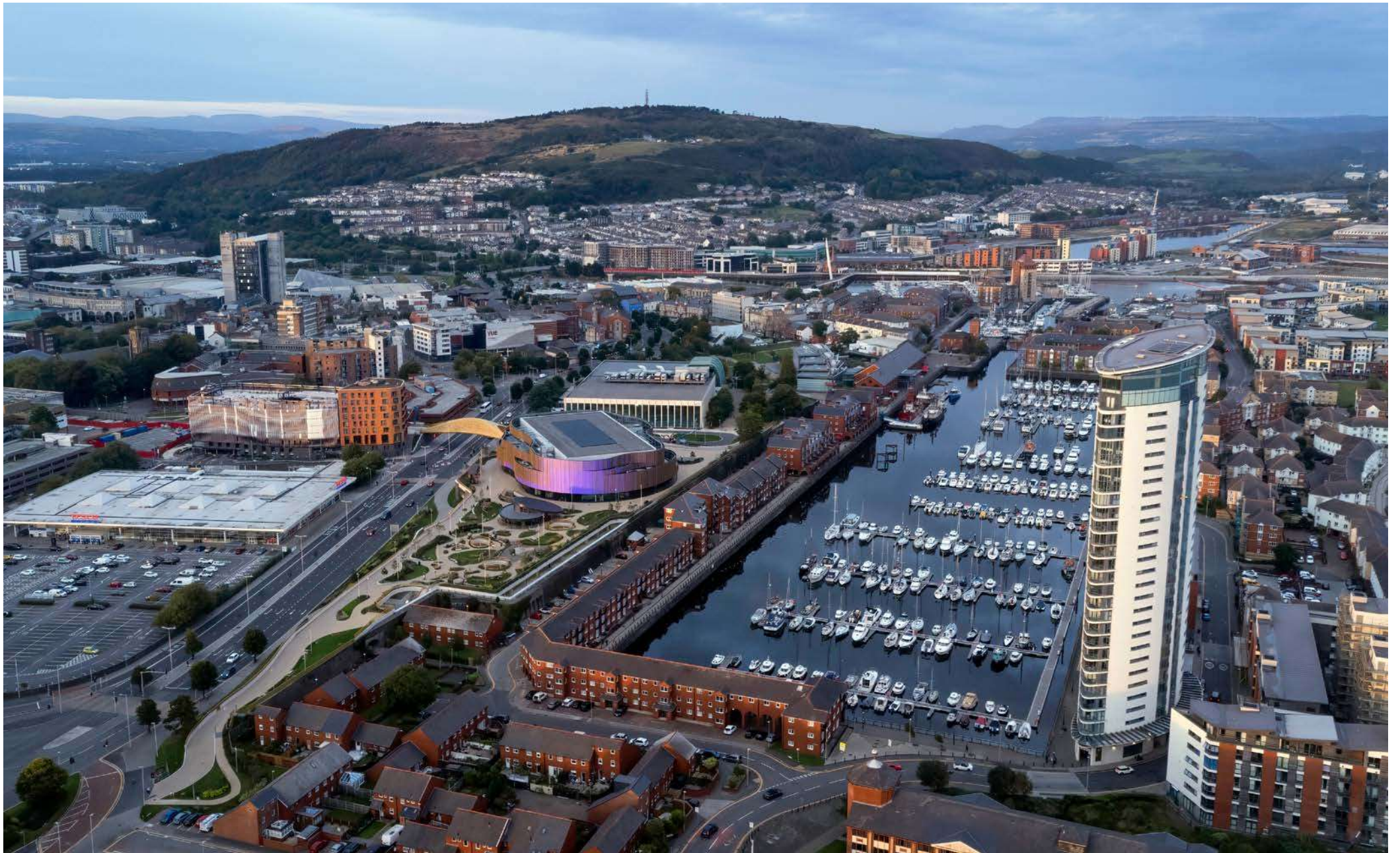
Strategaeth Trais yn erbyn Menywod, Cam-drin Domestig a Thrais Rhywiol Abertawe 2023-2026