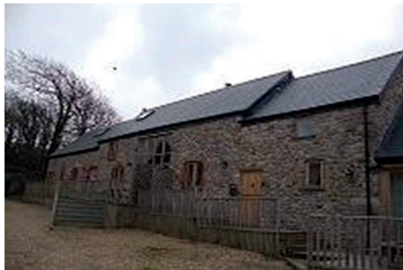
Uchod: Hen ysguboriau wedi'u haddasu, Ysguboriau'r Eglwys, Llanmadog

3.20 Dylai ymgeiswyr at ddefnydd busnes (ac eithrio llety twristiaeth) felly nodi pam mae natur y busnes yn golygu bod angen lleoliad cefn gwlad, gan gynnwys pam nad yw'r ardaloedd cyflogaeth presennol yn addas neu ar gael.