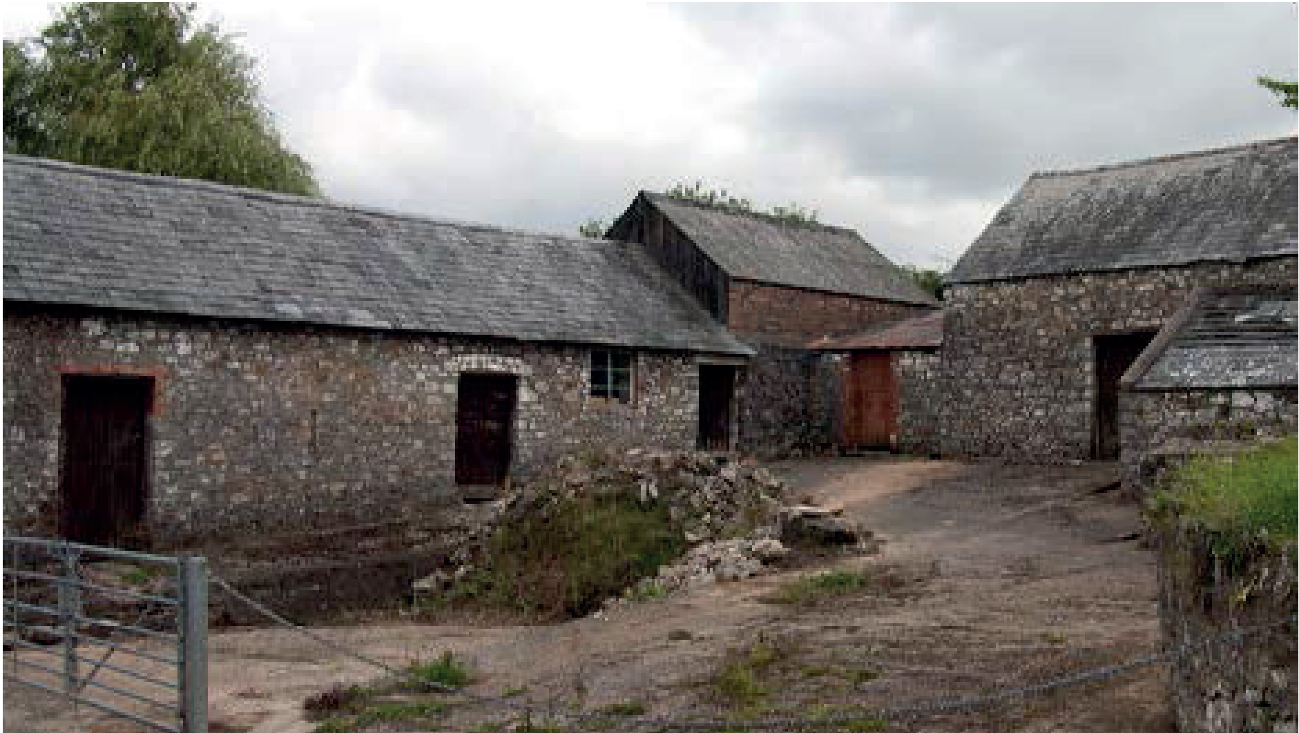
Uchod: Llun o grŵp o adeiladau fferm sy'n addas i'w haddasu