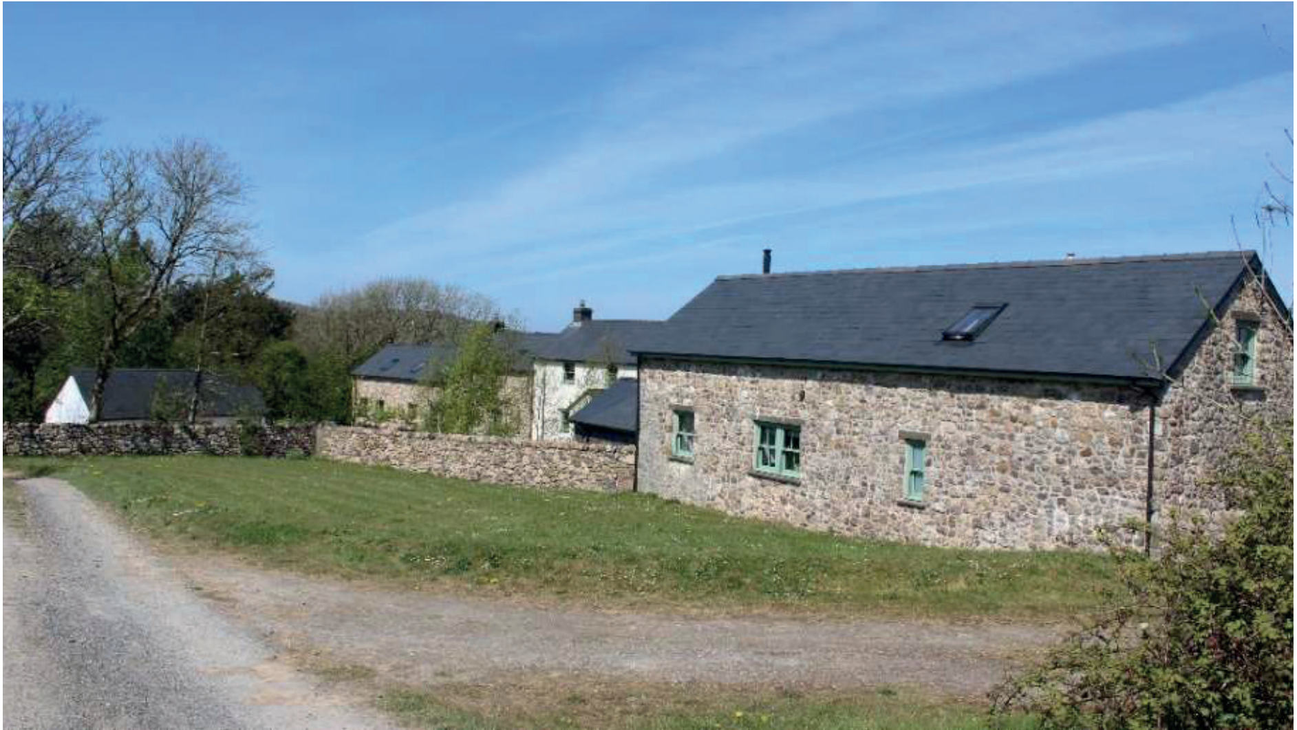
Uchod: Adeilad fferm wedi'i addasu, Gŵyr