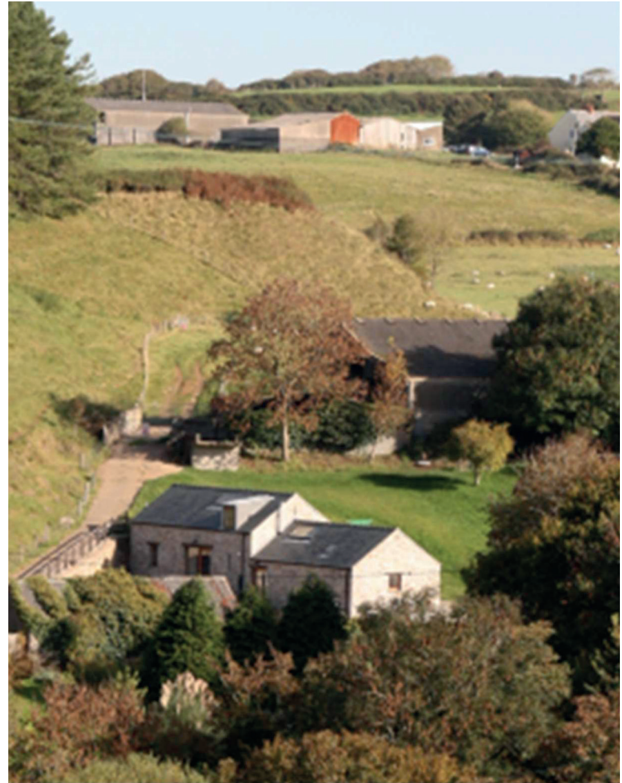
Uchod: Ardal o gefn gwlad gydag ysguboriau wedi'u haddasu, Cheriton.

2.16 Mae'r polisi'n nodi ystod o feini prawf polisi y mae angen i gynigion fynd i'r afael â hwy er mwyn cael eu hystyried yn addas. Mae Adran 3 o'r Canllawiau hyn yn rhoi rhagor o wybodaeth i gadarnhau sut y caiff y meini prawf eu cymhwysu fel rhan o'r broses o benderfynu a yw adeilad yn addas i'w addasu.