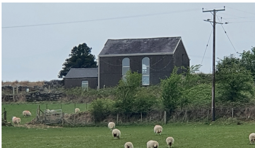
Uchod: Enghraifft o adeilad gwledig traddodiadol, hen Gapel Gerazim, Felindre.

3.13 Nid yw'r materion a amlinellir uchod yn ddisgrifiad cynhwysfawr o'r holl faterion a ystyrir wrth benderfynu a yw adeilad yn draddodiadol. Bydd angen i'r holl ffactorau perthnasol gael eu hystyried gyda'i gilydd, yn dibynnu ar amgylchiadau a nodweddion y safle, a chan gyfeirio at gyd-destun ehangach y CDLI a'r holl bolisiau cenedlaethol perthnasol.