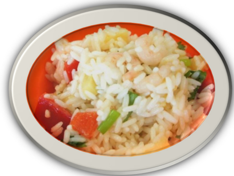
Reis corgimwch trofannol