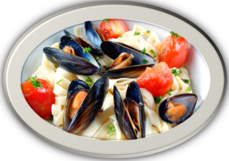
Pasta cregyn gleision a tomato