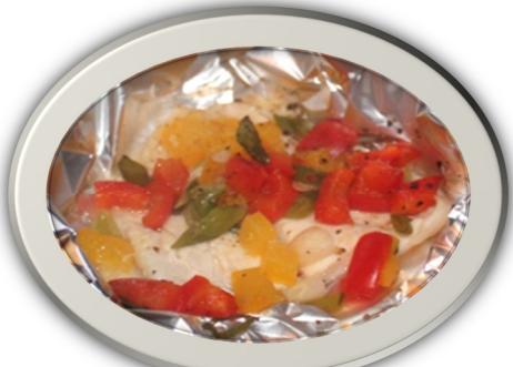
Parseli lleden a phapur