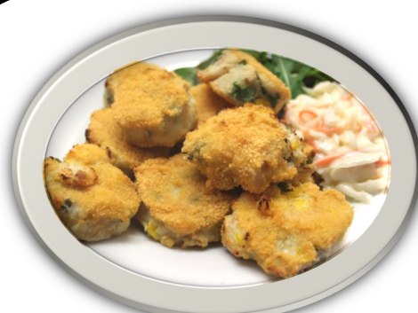
Cacennau cranc crensiog