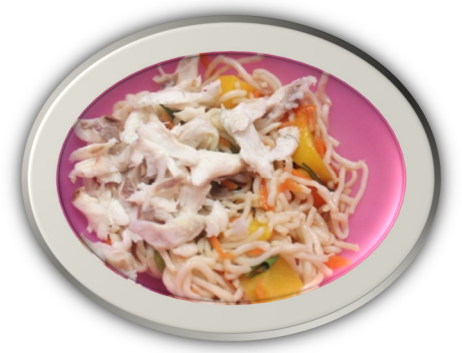
Salad draenogyn môr ffrwythaidd