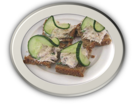
Pâté macrell wedi'i gochi